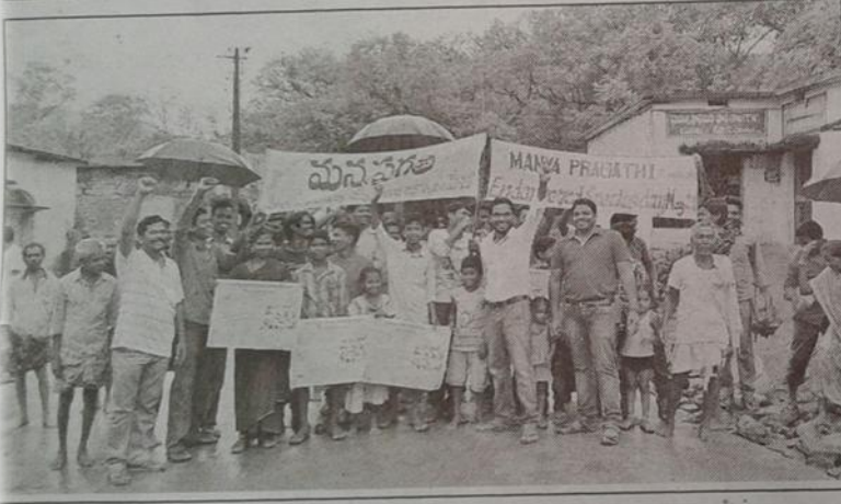
చిన్నకంబలో వన్య ప్రాణుల సంరక్షణపై అవగాహన ర్యాలీ