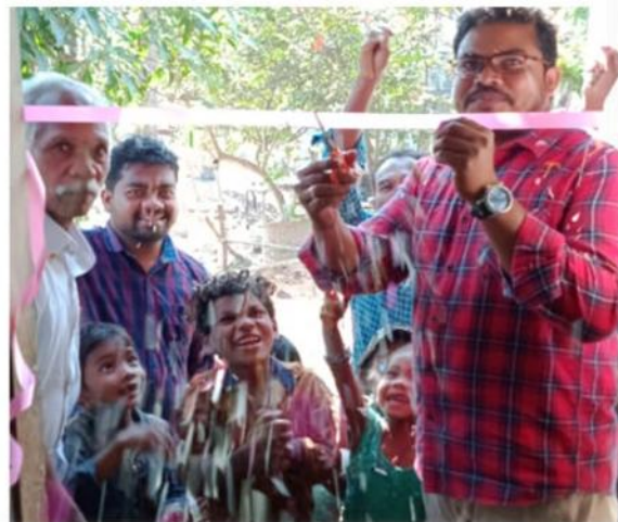
Digital Education Learning Innovation clusters (15. 01.2021) Inauguration ceremony at Peddapallanki Valasa, Samarelli, Donubhayi and Chilagam