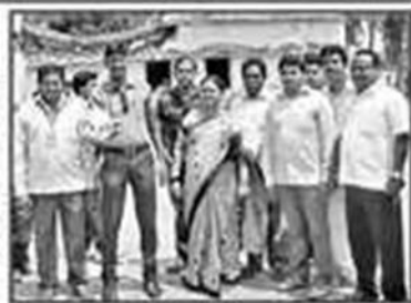
వాలీబాల్ పోటీల ప్రారంభం, సీతంపేట స్థాయి